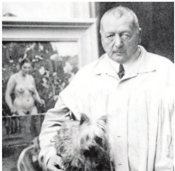
Konstnären och skidentusiasten Anders Zorn i sin ateljé 1900.