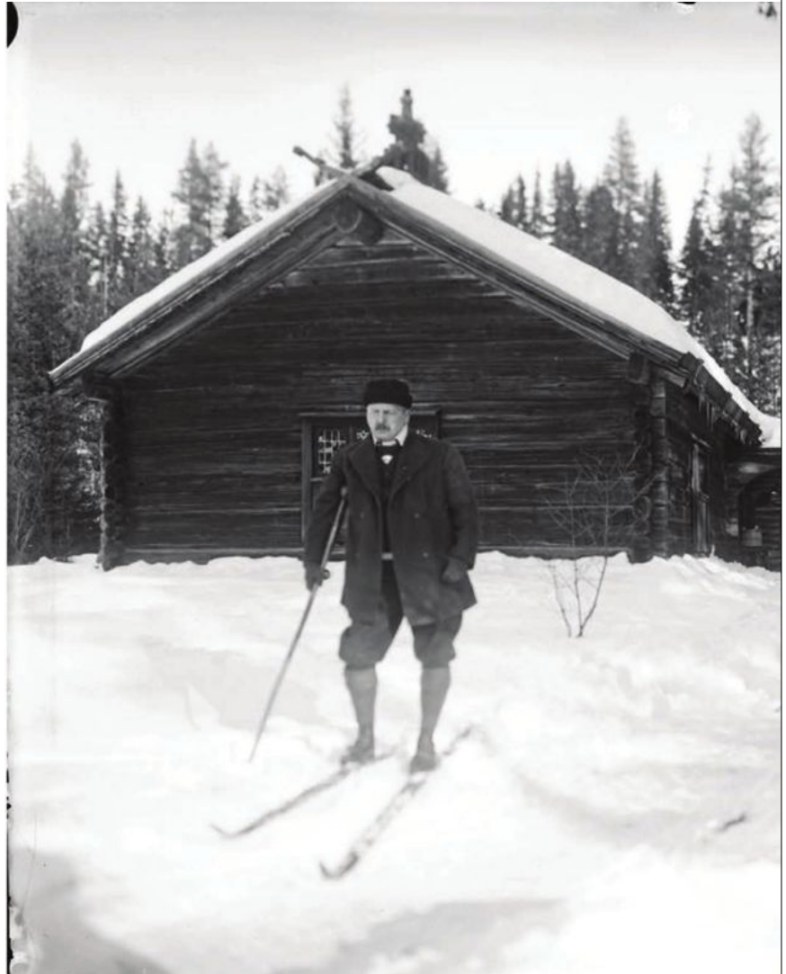
Anders Zorn i skidspåret. En ny utställning i Zornmuseet handlar om konstnärens intresse för skidor och skidtävlingar.